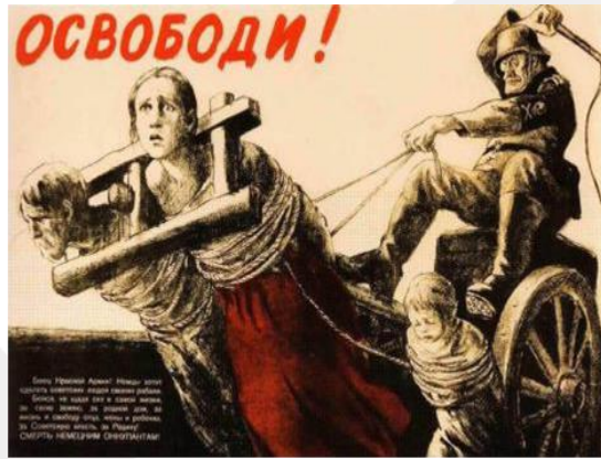
Nazilerin "aileleri köleleştireceği" temasının işlediği posterlerden birisi. (SSCB) "Bizi Özgür Bırakın!"