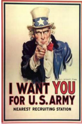
ABD'nin asker toplamak için kullandığı Sam Amca'lı (Uncle Sam) Poster. "Seni İstiyorum!" (I Want You!)

II. Dünya Savaşı'nda da başta afişler ve posterler olmak üzere, radyo yayınları ve popüler sanatçılar toplumsal algının yönetilmesi maksadıyla, halkı savaşın gerekliliği ve haklılığına ikna etmek, dünya kamuoyunun ve halkın desteğinin kazanmak, düşman kamuoyuna yönelik ise tehdit ve korku yaratmak için yoğun olarak kullanılmıştır. Genel olarak; "niçin savaşıyoruz?", "düşman kim?", "savaşmazsak başımıza ne gelir?" ve "bize karşı savaşırırsanız başınıza bunlar gelecek!" temalarını işleyen ve aşağıda iki adet örneği bulunan birçok afiş ve poster kullanılmıştır. 19